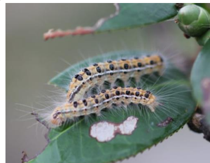
チャドクガの幼虫

チャドクガの幼虫は、みなさんがよく知っている“毛虫”の見た目をしています。毒針が肌にささると、いたくなったり、かゆくなくなったりします。これからあたたかくなってくると、一色西部小学校でも、保健室前・体育倉庫近くのツバキの木近くによく見られます。見つけたらさわらず、近よらず、先生に知らせてください。もしさされてしまったら、かいたりせず保健室へ来てくださいね。