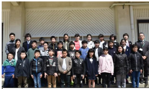
6年1組 級訓 「限界の果てまで イッテQ～」