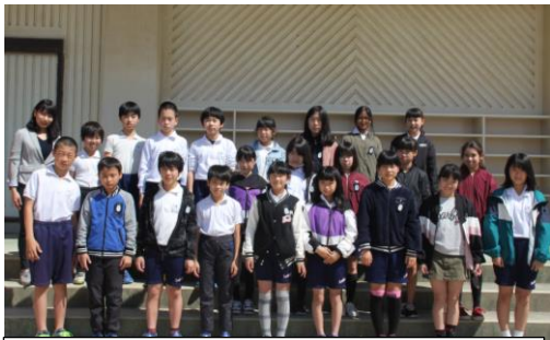
6年2組 級訓 「飛翔」