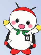
室小キャラクター 「ホタルん」